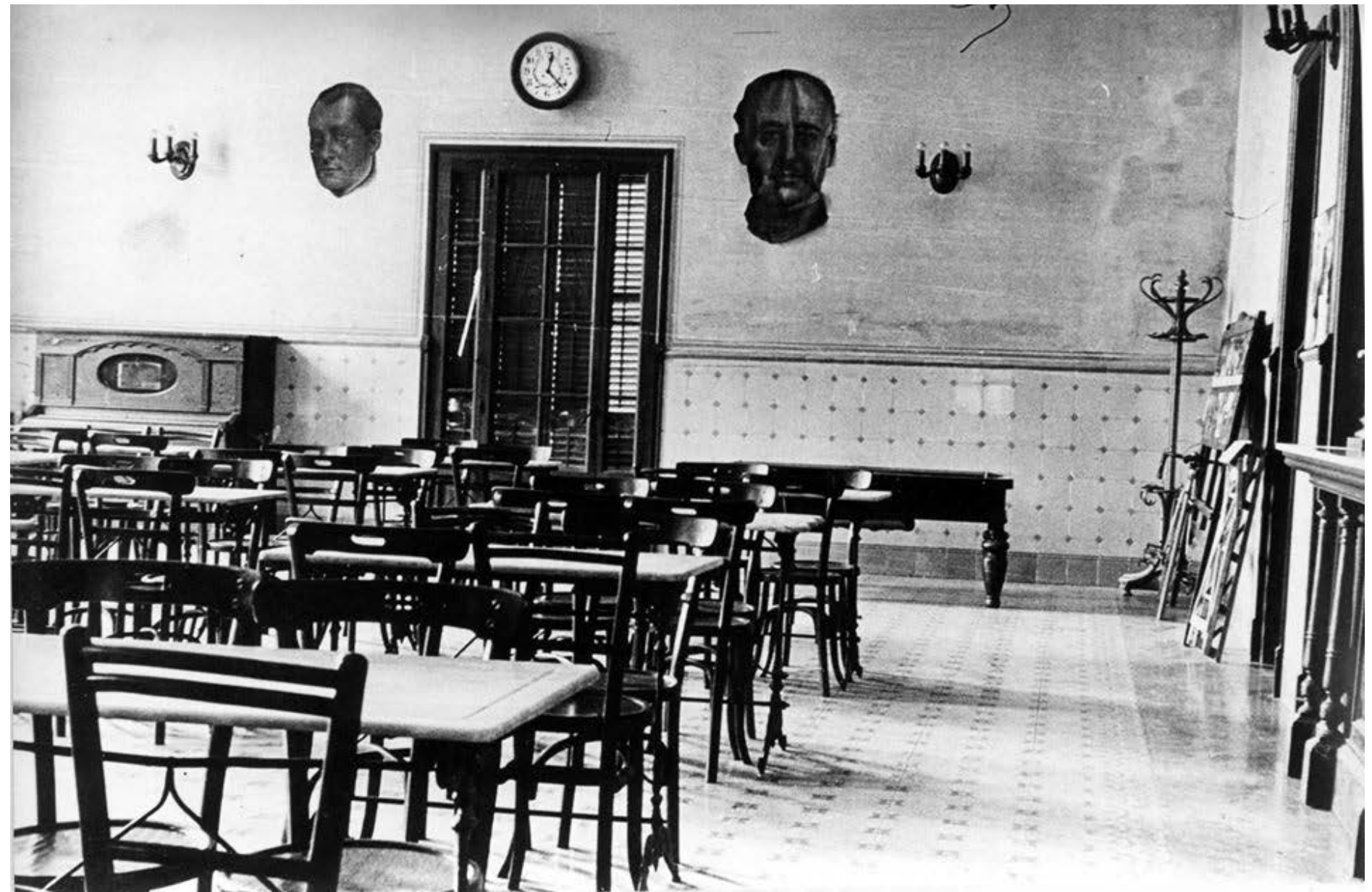
Interior del café-bar on malauradament s'hi van haver de pintar les imatges de Franco i José Antonio a la paret