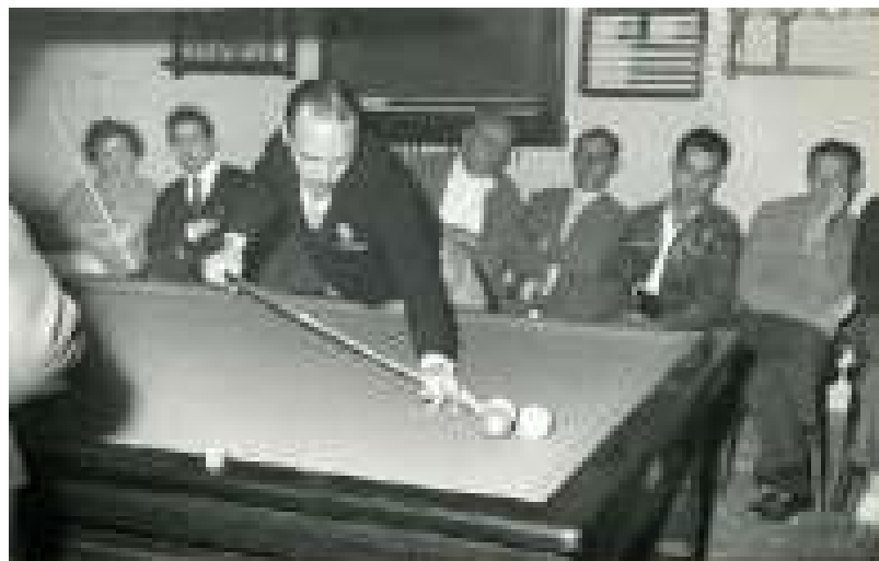
Sala del billar, un punt de trobada molt concorregut a l'època